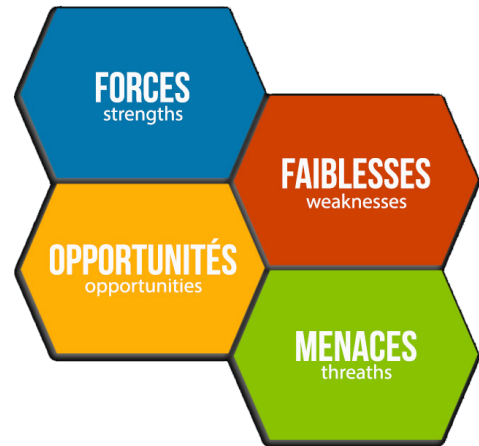
Illustration ci-contre de la méthodologie SWOT

A l'aide d'un barème pondéré, se basant sur des critères d'analyses (fonctionnels, techniques, organisationnels...) cette analyse permet de définir de manière ciblée et chiffrée les différents prestataires qui répondent aux besoins.