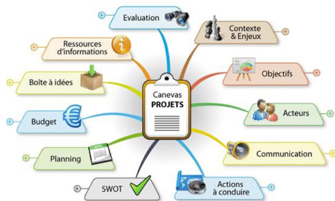
Exemple d'illustration d'un mindmapping

Cette étape constitue les premiers éléments de votre cahier des charges.